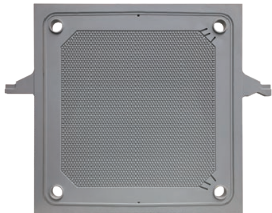
Filterplatte mit Noppenfeld und umlaufendem O-Ring