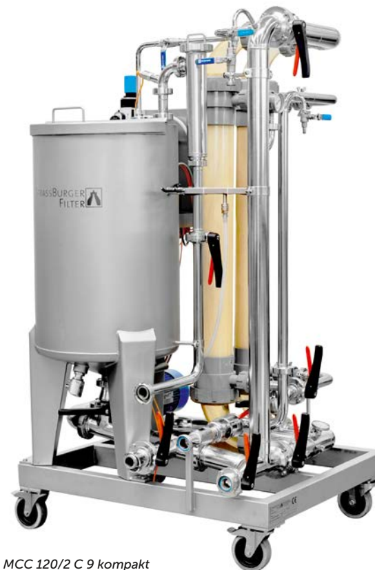
MCC 120/2 C 9 kompakt

Chemieansaugung (vorgemischt) auch bei Manuellen und Halbautomaten Standard