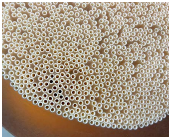
Ausschnitt eines Hohlfasermoduls