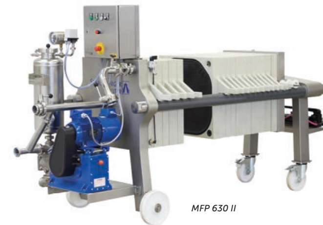
MFP 630 II

keine Tropfverluste leichte Reinigung CIP-Reinigung der gesamten Tuchfläche Nasskonservierung möglich