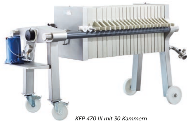
KFP 470 III mit 30 Kammern